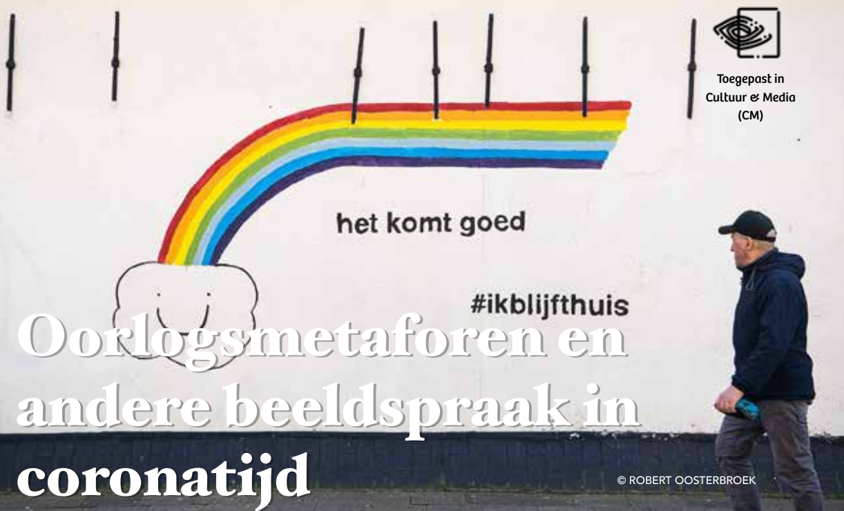
Door: Martin Slagter

Al wekenlang gaat het in de media over vrijwel niets andere dan de coronacrisis. Kranten en tv-programma's vullen hun kolommen en zendtijd met nieuws en meningen. Voor een Toegepast Filosoof kan het interessant zijn om na te gaan wat voor taal daarbij gehanteerd wordt. Of, om nauwkeuriger te zijn: welke metaforen zijn leidend in ons spreken over het venijnige virus, dat ons leven danig in de war schopt.