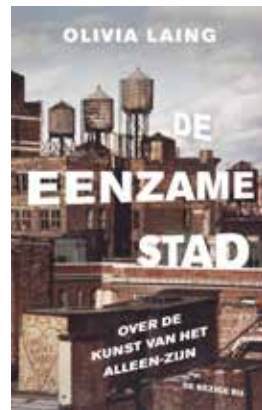
COVER: DE EENZAME STAD - OLIVIA LAING