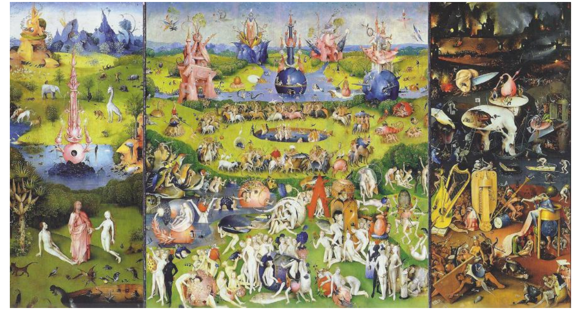
© DE TUIN DER LUSTEN VAN JEROEN BOSCH

Als we de interpretatie van ras als technologie volgen, dan worden de regels die bepalen hoe we het concept 'ras' behoren te gebruiken (en daarmee 'racisme', 'racist', etc.), niet bepaald door de wetenschap maar door macht. In de 19e eeuw werd de wetenschappelijke definiëring en onderbouwing van racisme populair, en vaak wordt de term tegenwoordig nog gebruikt in