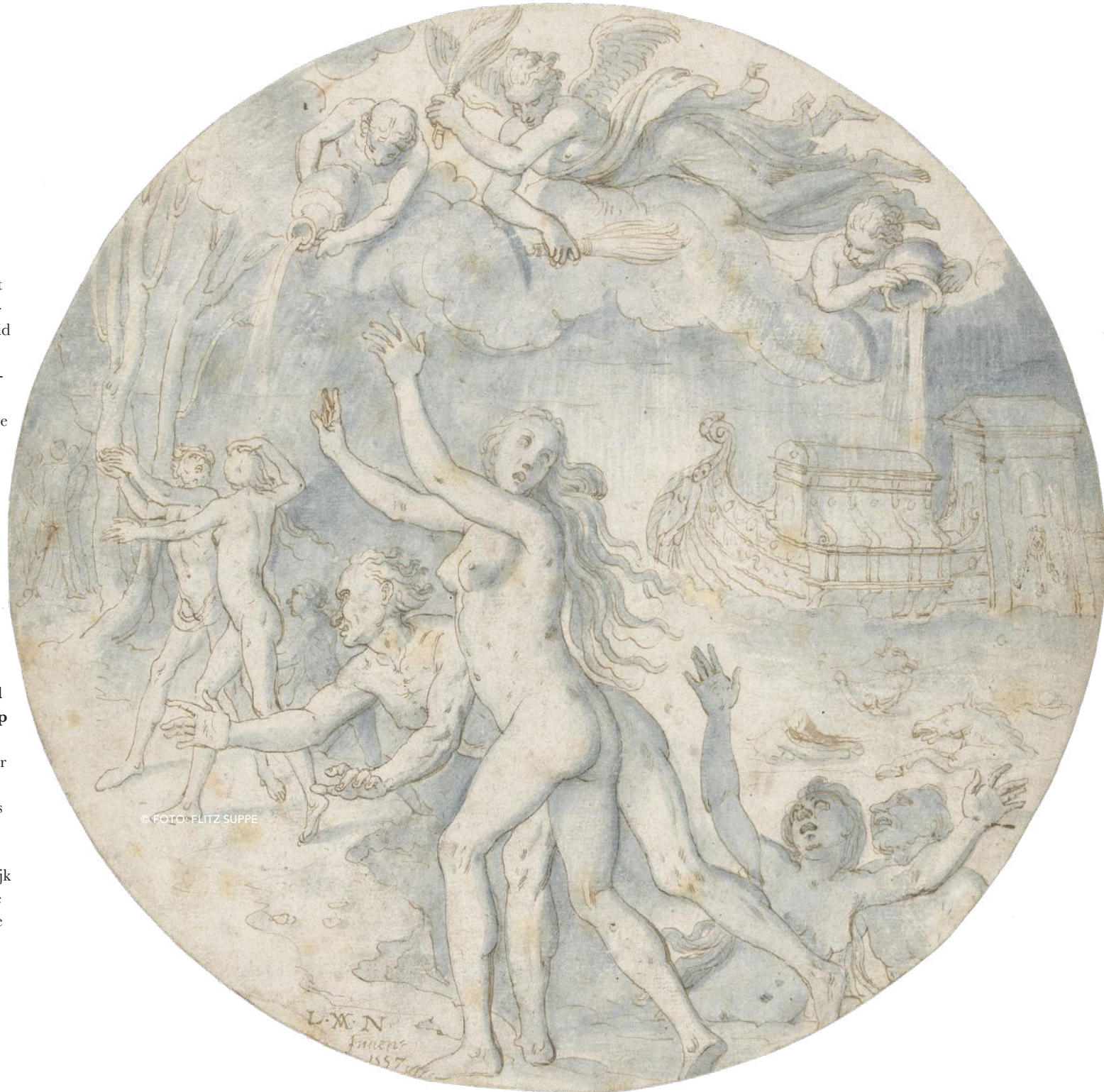
© “DE ZONDVLOED, LAMBERT VAN NOORT, 1757” RIJKSMUSEUM

“Identiteit is vooral gevormd in oorlogen, als er een gemeenschappelijke vijand is. We hebben Europa opgebouwd in ellende en de generaties die de ellende aan den lijve hebben ondervonden, zijn bezig te verdwijnen. Nu vragen mensen zich af waarom hebben we Europa eigenlijk nog nodig. Helaas hebben we blijkbaar ellende nodig om ons te verbinden en autonomie op te geven.”