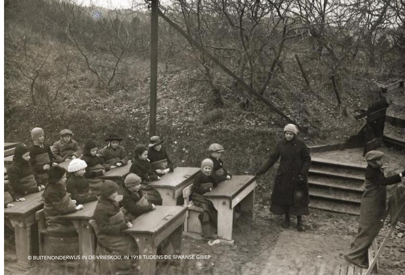
© BUITENONDERWIJS IN DE VRIESKOU, IN 1918 TIJDENS DE SPAANSE GRIEP

Helemaal prima dus, dit werken en studeren vanuit huis. Maar ik realiseer me heel goed dat dit niet meer zo leuk is als het eeuwig duurt én dat onze ervaring voor een groot deel bepaald wordt door gelukkige omstandigheden. Wij hebben een ruim huis met een grote studio waar drie goede werk- en gameplekken zijn. Daarnaast is er elders in huis ook voldoende plek om te videobellen, te gamen of in alle rust een (studie)boek te lezen. En alle benodigde voorzieningen zijn ruimschoots aanwezig: snel internet en iedereen een