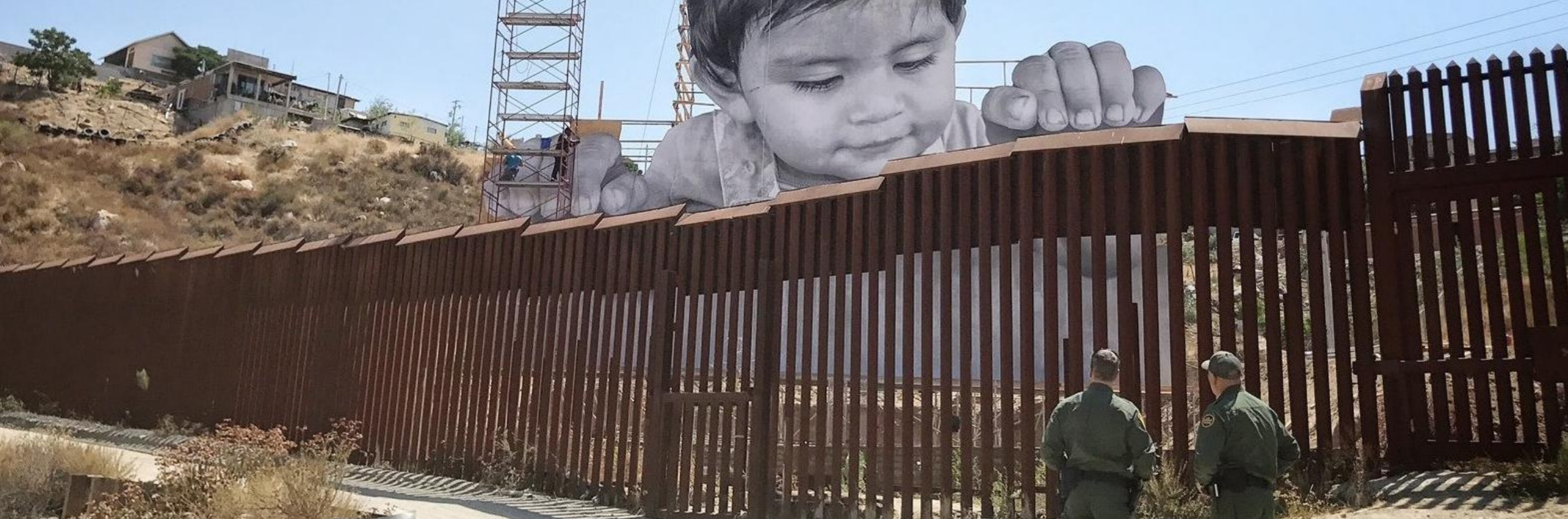
"DIT WERK VAN DE FRANSE KUNSTENAAR JR STOND AAN DE GRENS TUSSEN DE V.S. EN MEXICO. EEN KIND KIJKT NIEUWSGIERIG OVER DE GRENS."